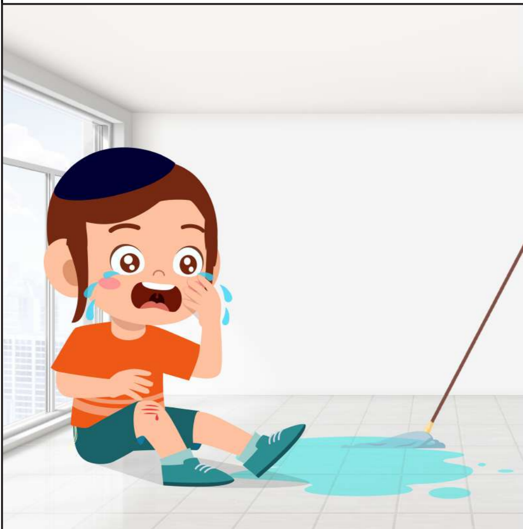
תגובה: יוסי נבהל ומתחיל לבכות