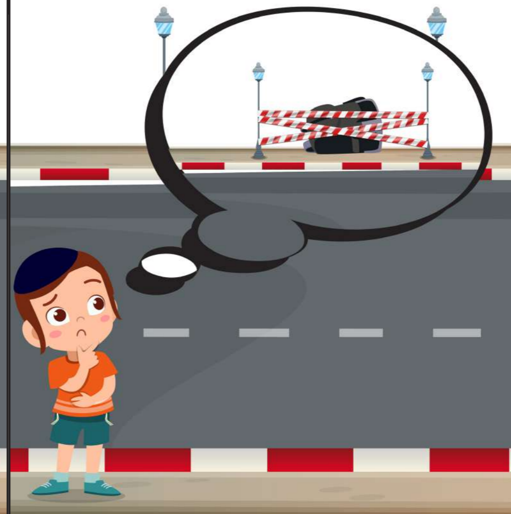
הארוע: יוסי חושב שיש חפץ חשוד