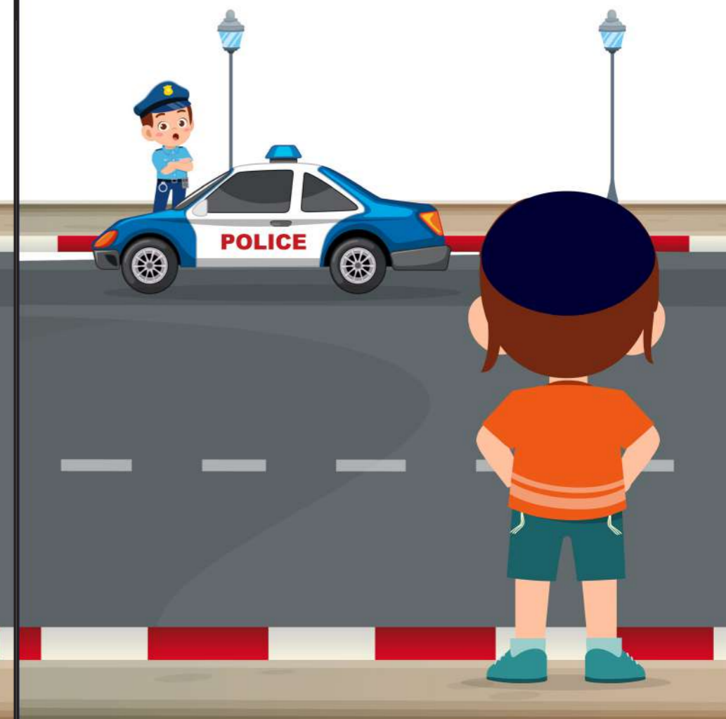
ארוע: יוסי רואה מכונית משטרה