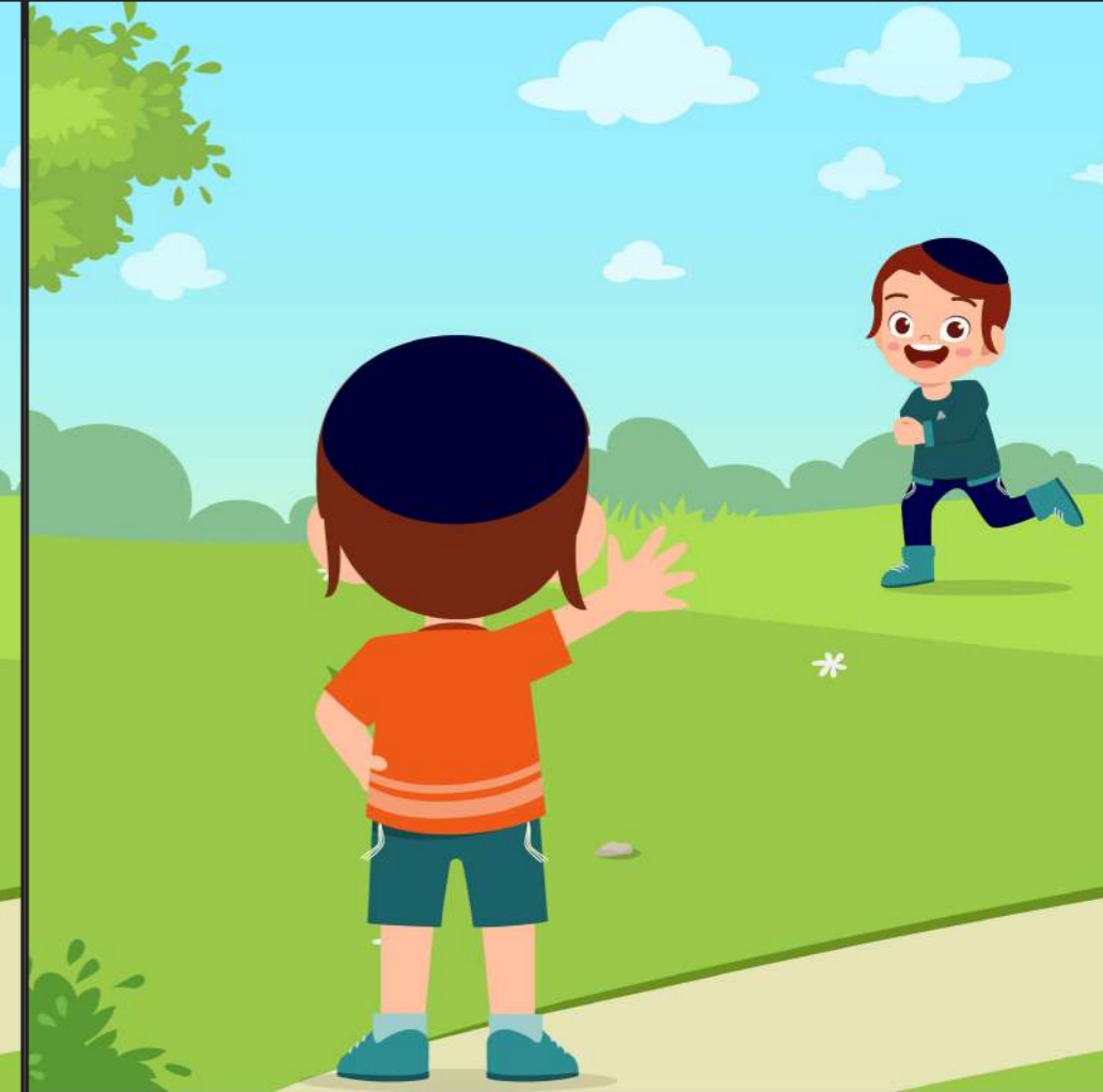
ארוע: יוסי רואה את חברו חיים רץ לקראתו