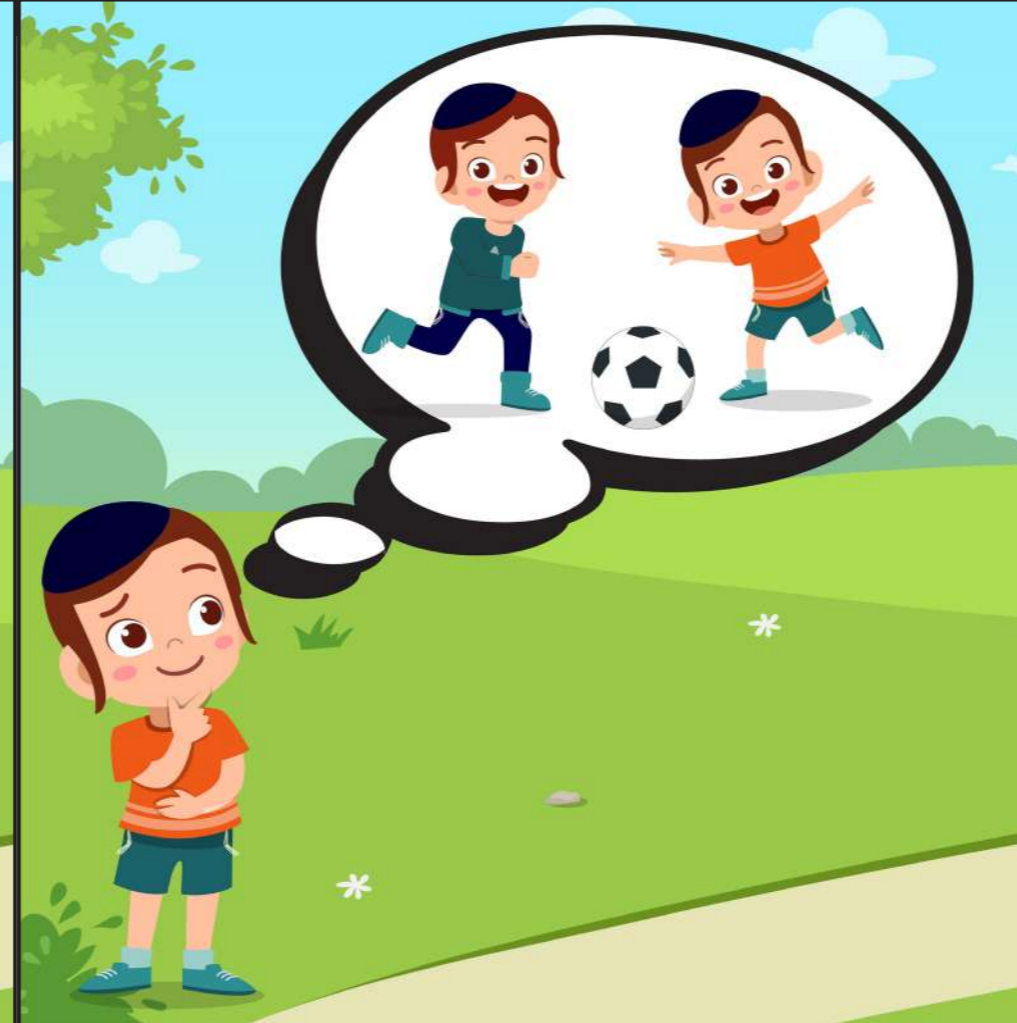
מחשבה: כנראה חיים רוצה לשחק איתי...