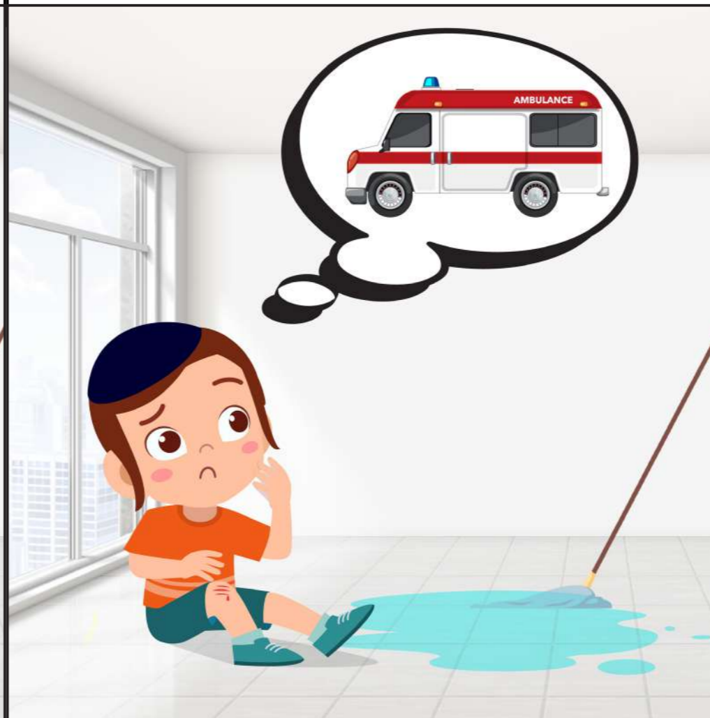
מחשבה: יוסי מפחד שקרה לו משהו מסוכן