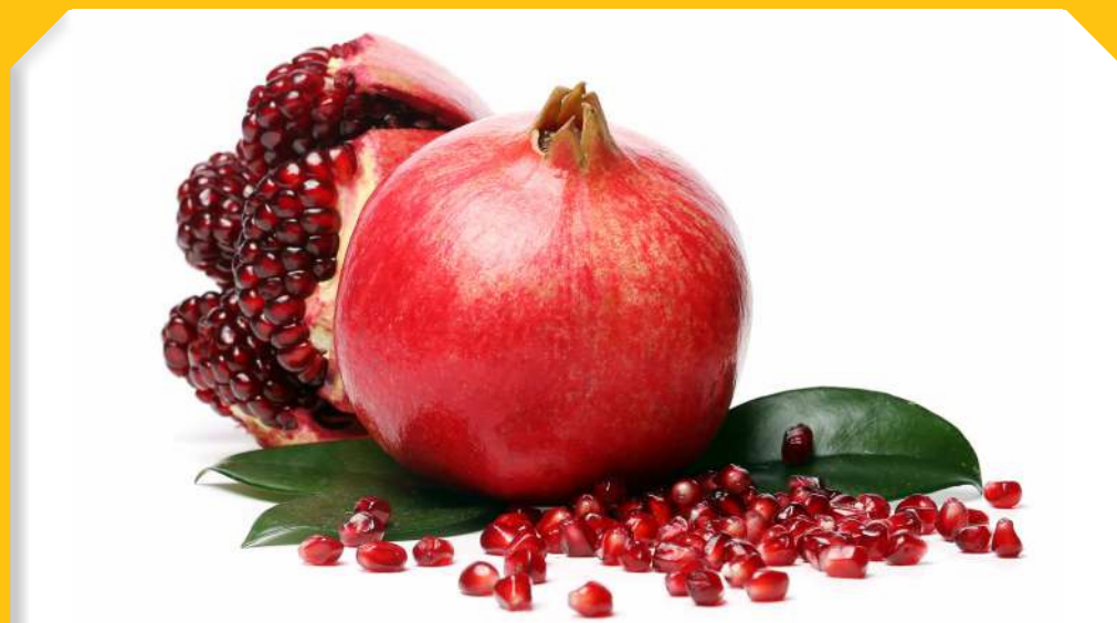
שְׁנָה שִׁירְבוּ זְכוּיוֹתֵינוּ