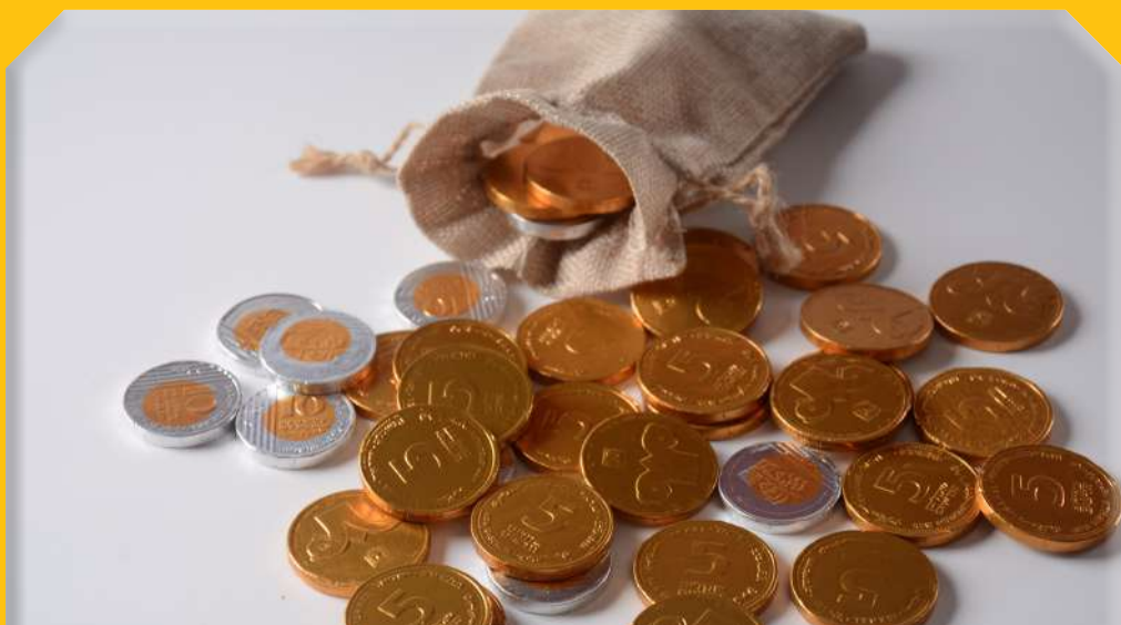
שְׁנַת פְּרִנָּה בְּשִׁפְעַ