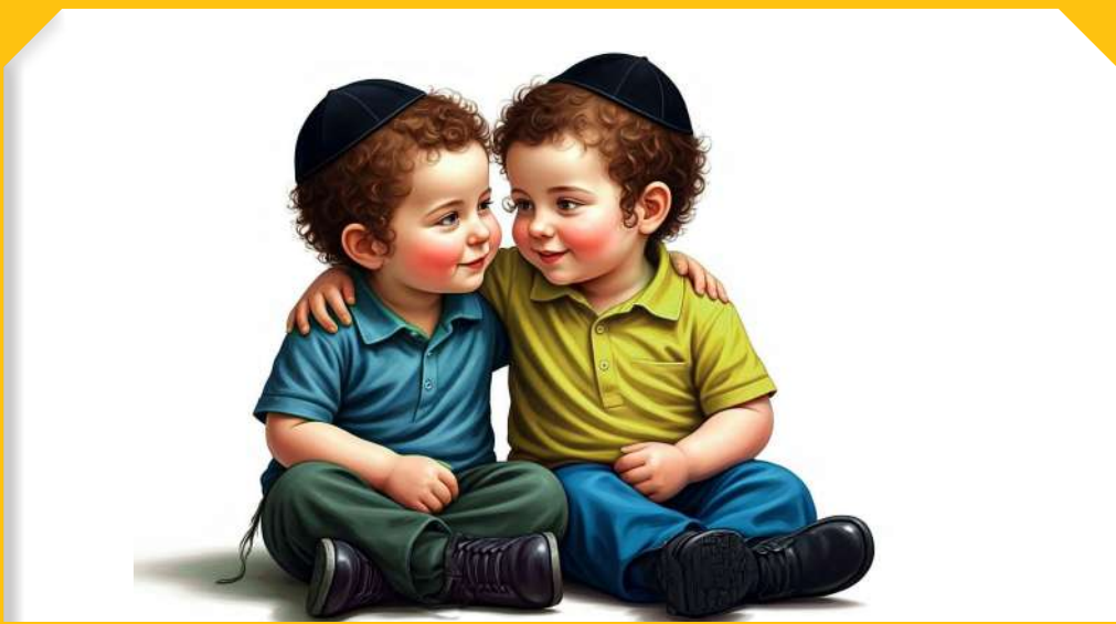
שָׁנָה נְשֵׁל אֶהָבָה