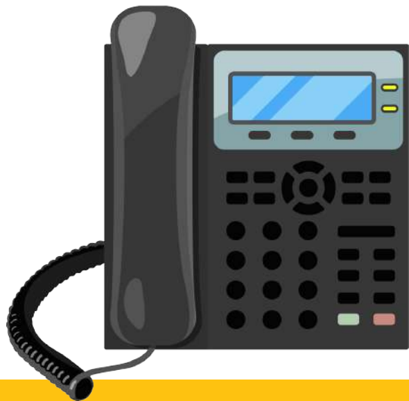
שְׁנֵי שָׁמַע בְּשׁוֹרוֹת טוֹבוֹת