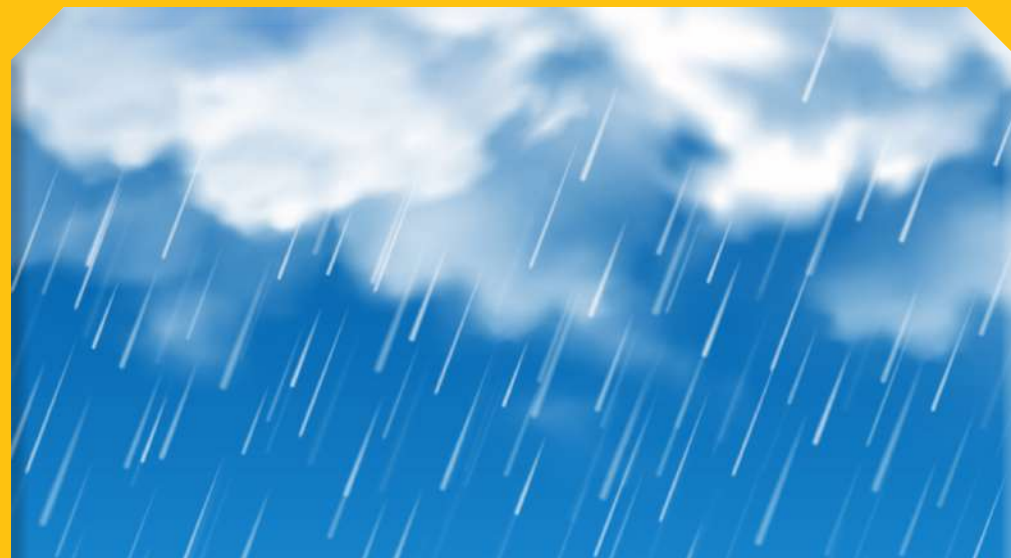
שְׁנַת גְּשָׁמִים בְּעֵתָם