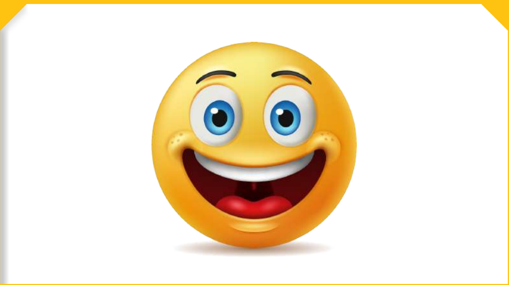
שָׁנַת שְׂמֵחָה וְאִשֵּׁר