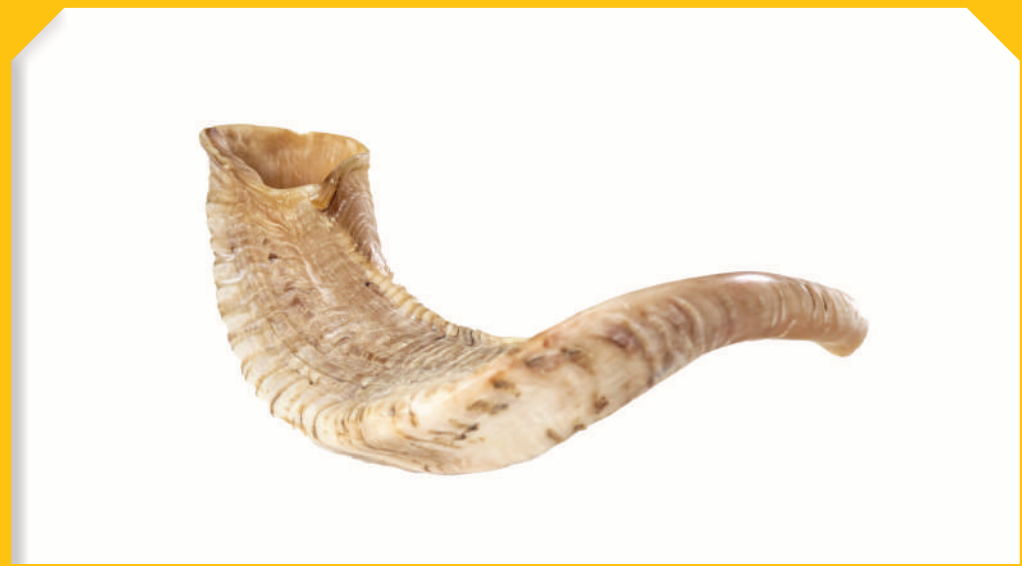
שְׁנַת סְלִיחָה וּמַחֲיֵלָה